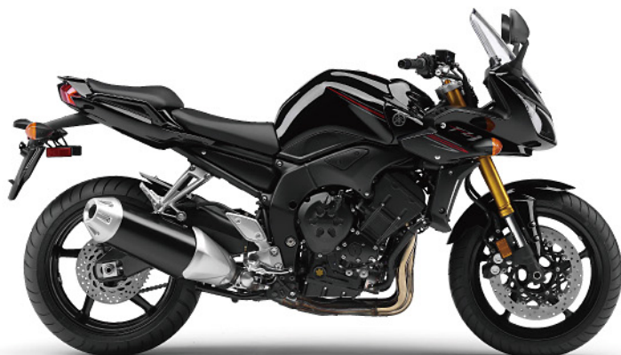
ブラックメタリックX (SMX)