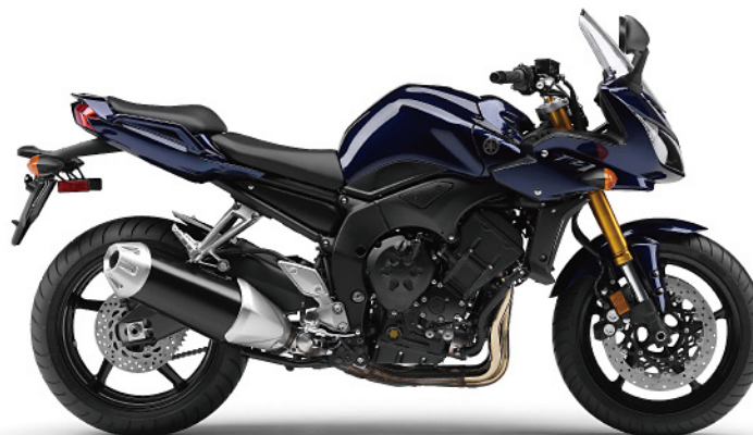
ダークパーブリッシュブルーメタリックU (DPBMU)