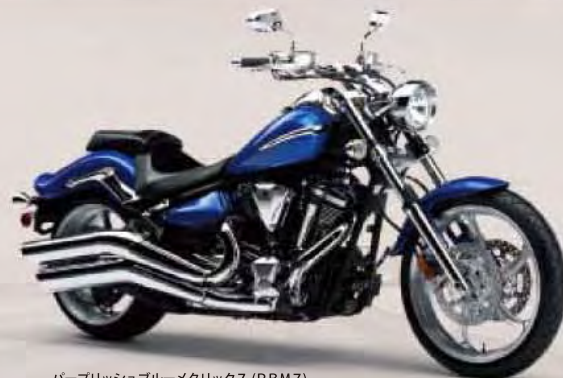
パーブリッシュブルーメタリック7 (PBM7)