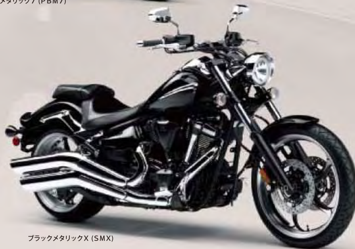
ブラックメタリックX (SMX)

●本仕様は予告なく変更することがあります。●仕様変更などにより写真や内容が一部実車と異なる場合があります。●ボディーカラーは印刷の為、実車と異なって見える場合があります。●諸条件により取扱い商品が変更になる場合もあります。●ご使用前には取扱い説明書をよくお読み下さい。●このリーフレット紙面に記載されている内容は予告なく変更することを予めご了承願います。