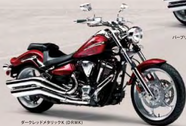
ダークレッドメタリックK (DRMK)