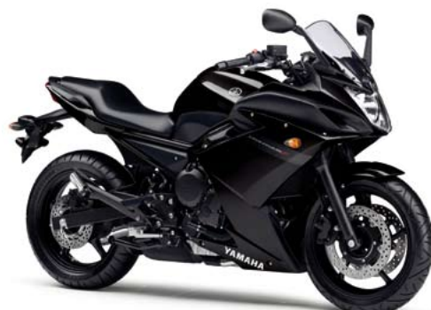
ブラックメタリックX (SMX)