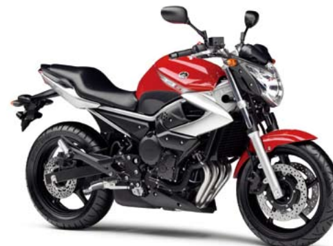
ビビッドレッドカクテル1 (VRC1)