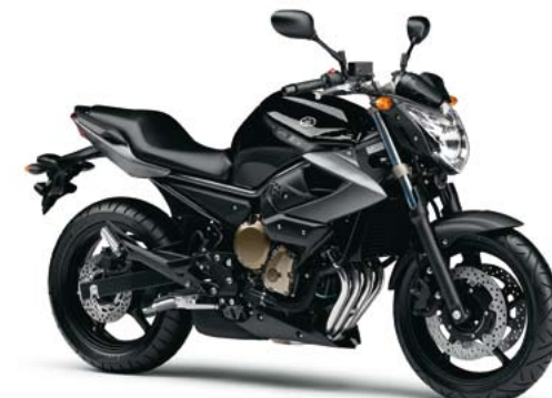
ブラックメタリックX (SMX)