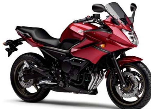
ディープレッドメタリックK (DRMK)