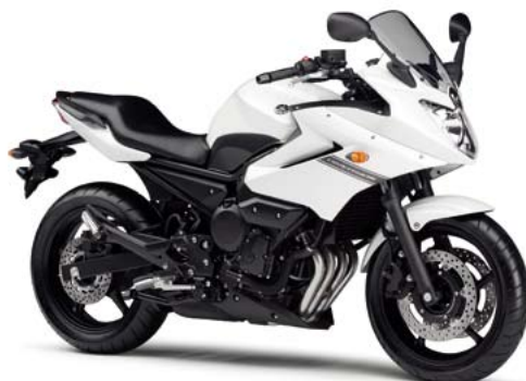
ブルーイッシュホワイトカクテル1 (BWC1)