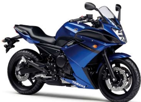
ビビッドパーブリッシュブルーカクテル5 (VPBC5)