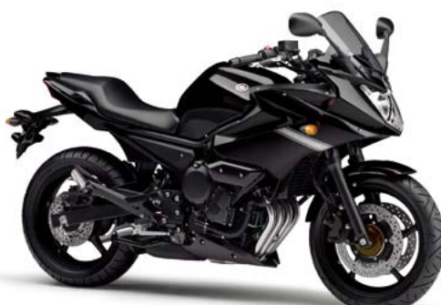
ブラックメタリックX (SMX)