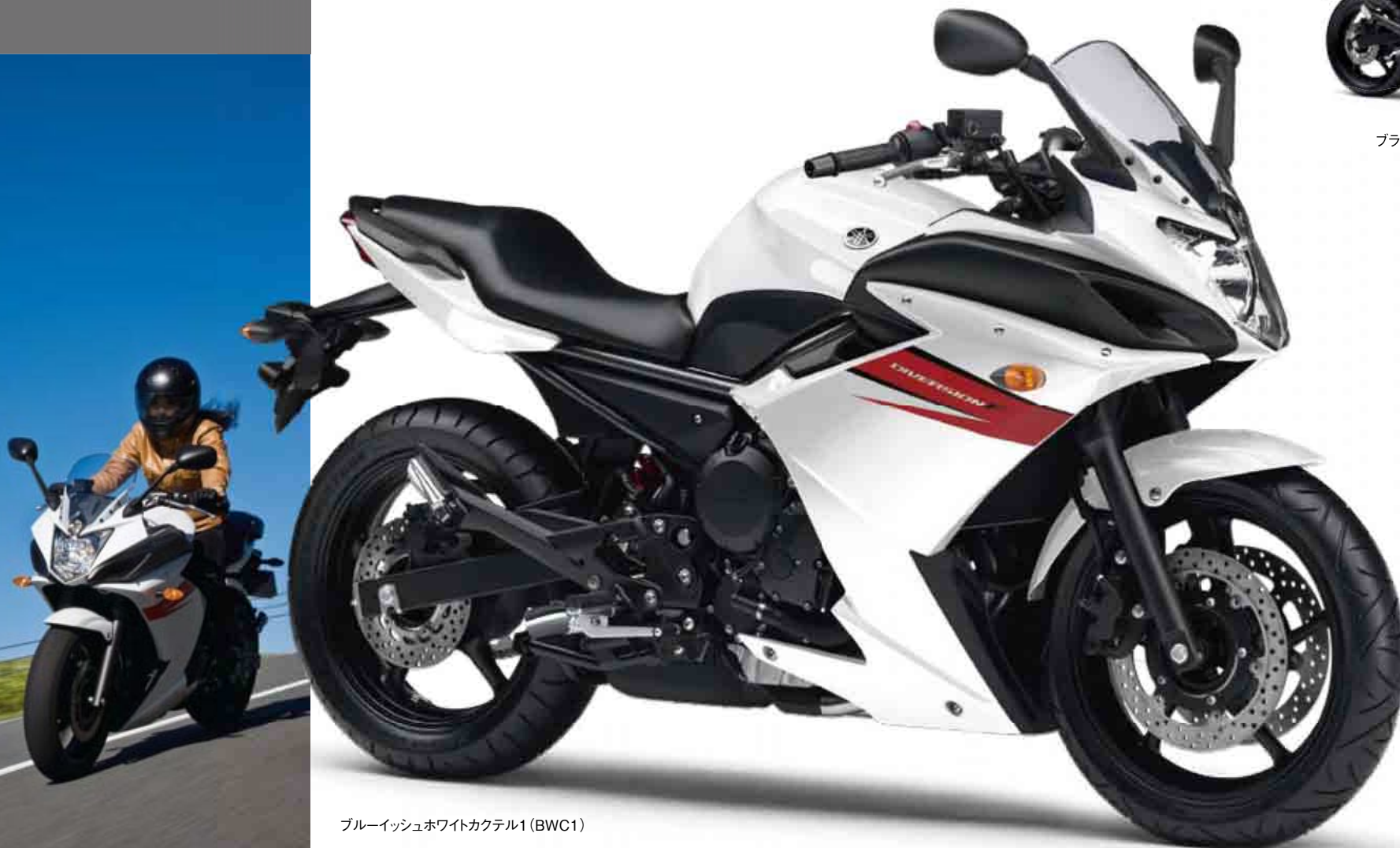
ブルーイッシュホワイトカクテル1(BWC1)