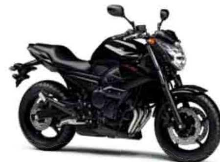
ブラックメタリックX (SMX)