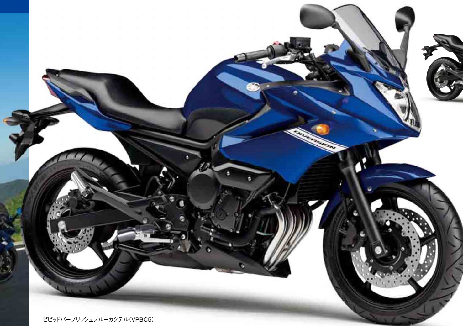
ビビッドパーブッシュブルーカクテル (VPBC5)