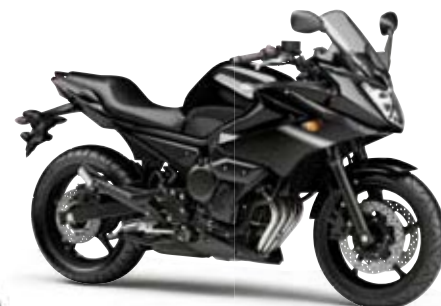
ブラックメタリックX (SMX)