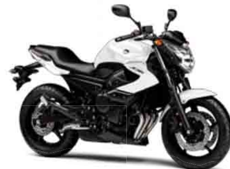
ブルーイッシュホワイトカクテル1 (BWC1)