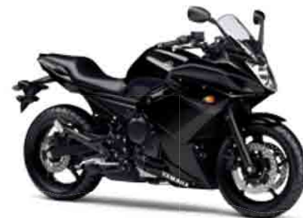
ブラックメタリックX(SMX)

スポーティーなフルカウルをまとったXJ6 DIVERSION Fは、サーキットから街乗り、ロングツーリングまであらゆる場面に万能に応えるマシンだ。低速から高速まで気持ちよくまわるエンジン、軽快で扱いやすいハンドリングにより、女性やビッグバイク初心者だけでなく、ベテランのライダーでさえも満足させる心地よい走りを実現。プレジャースポーツを手軽に、もっと楽しく。それがXJ6 DIVERSION Fだ。