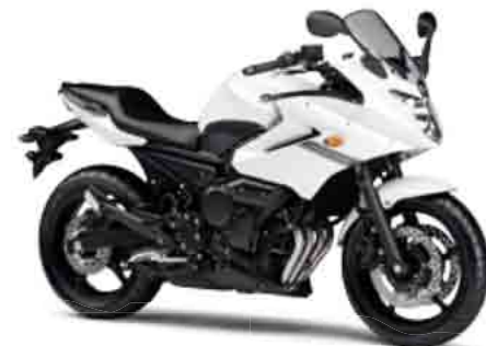
ブルーイッシュホワイトカクテル1 (BWC1)