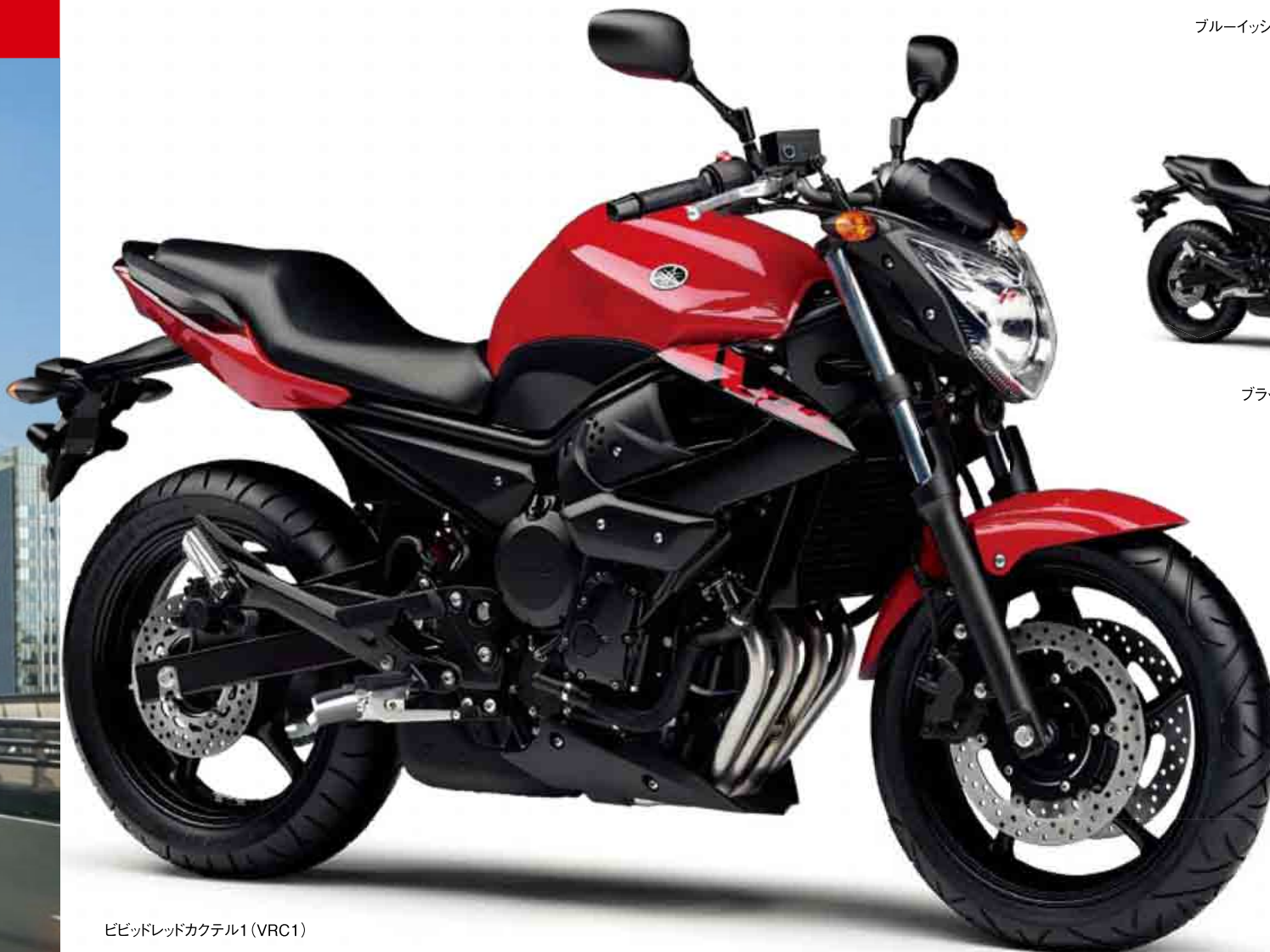
ビビッドレッドカクテル1 (VRC1)