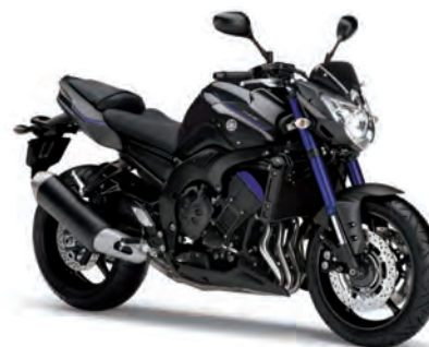
ダークグレーメタリックN (DNMN)