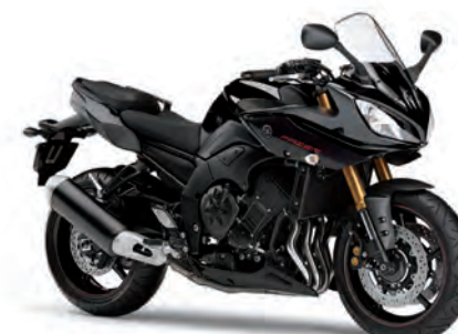
ブラックメタリックX (SMX)