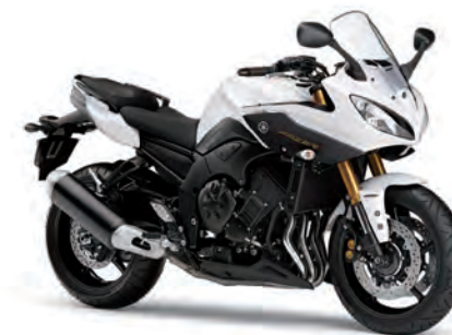
ブルーイッシュホワイトカクテル1 (BWC1)