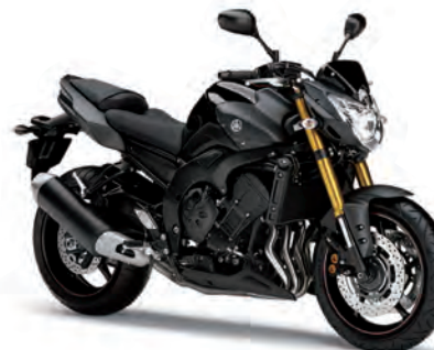
ブラックメタリックX (SMX)