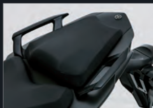
FAZER8 ABS / FAZER8に装備