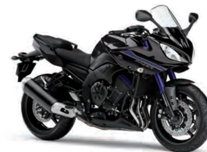
ダークグレーメタリックN (DNMN)