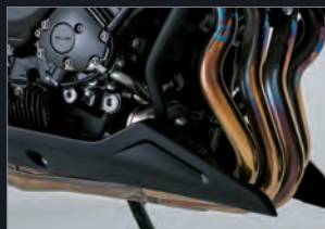
FZ8 ABS / FAZER8 ABSに装備

FZ8 ABS / FAZER8 ABSには、小石の跳ねなどからエキゾーストパイプ、エンジンをガードしながら、全体をスマートに見せるアンダーカバーを標準装備している。また、FAZER8 / FAZER8 ABSにはタンデムライダーの快適性をサポートするグラブバーを装備している。