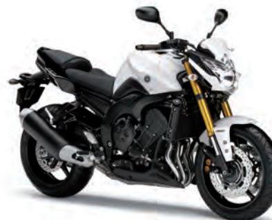
ブルーイッシュホワイトカクテル1 (BWC1)