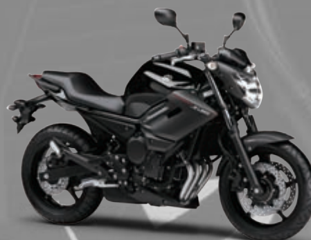
ブラックメタリックX(SMX)