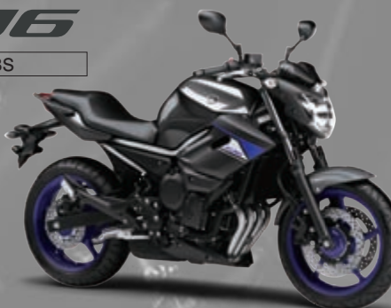
ダークグレーメタリックN(DNMN)