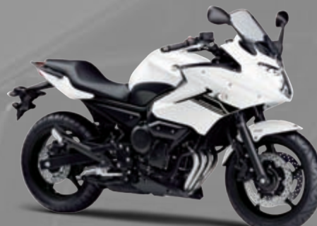
ブルーイッシュホワイトカクテル1(BWC1)