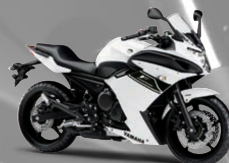
ブルーイッシュホワイトカクテル1(BWC1)