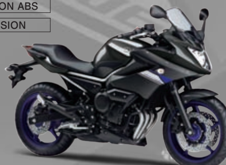
ダークグレーメタリックN(DNMN)