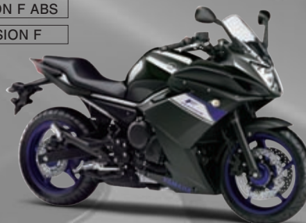
ダークグレーメタリックN(DNMN)