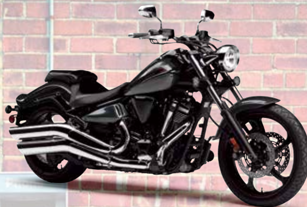
ダークグレーメタリックN (DNMN)