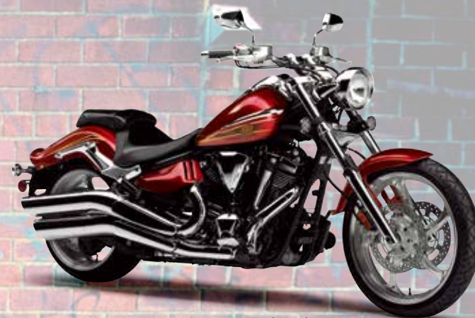
ダークレッドカクテルB (DRCB)