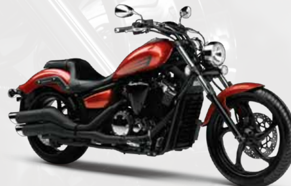
ダライエロイッシュレッドカテル4(DYRC4) ※継続販売モデル