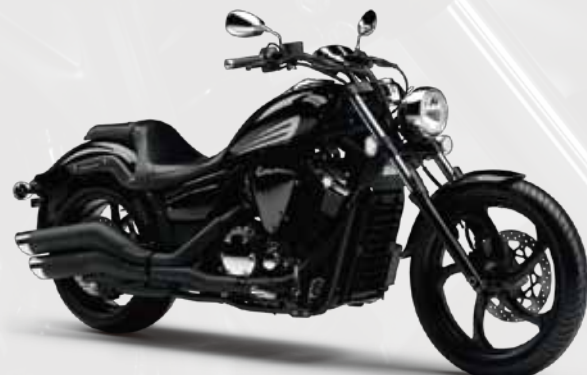
ブラックメタリックX(SMX) ※継続販売モデル