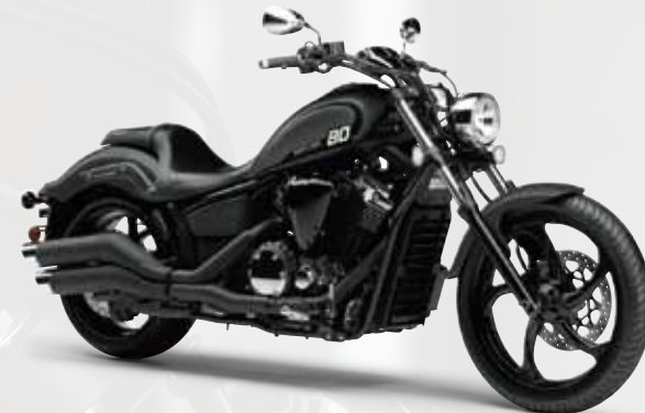
マットグレーメタリック3(MNM3)